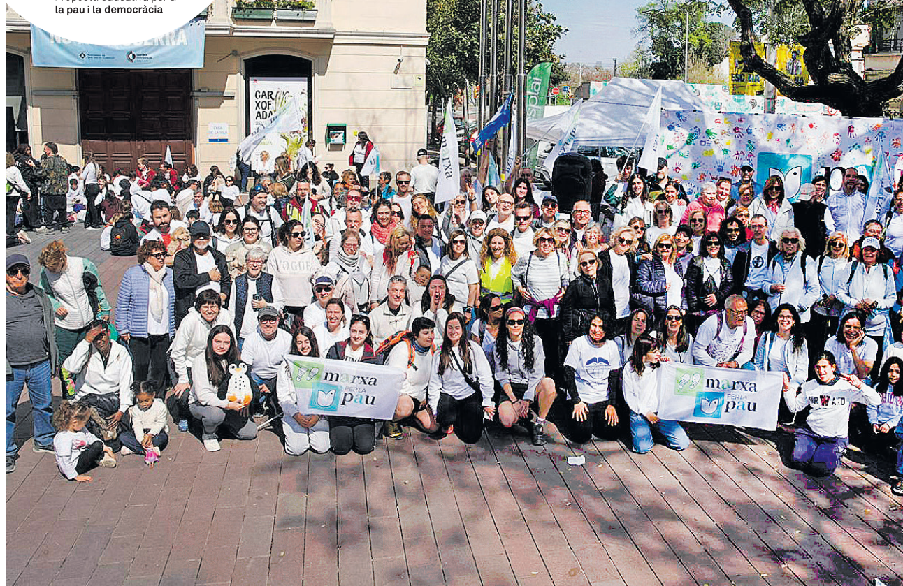
Clam per la pau. La plaça de l'Ajuntament de Sant Boi de Llobregat va acollir la multitudinària cloenda de la Marxa per la Pau.