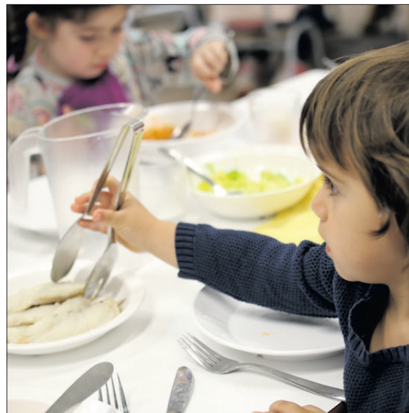
Autonomia. Els infants se serveixen el menjar.

Això no és un fet aïllat, sinó que forma part d'una mirada global. Des