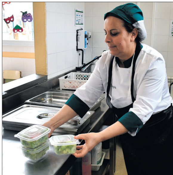
Carmanyoles. Es dona el menjar que no s'ha consumit.

A través d'aquesta iniciativa, el menjar que no s'ha consumit però que es troba en perfectes condicions es redistribi-