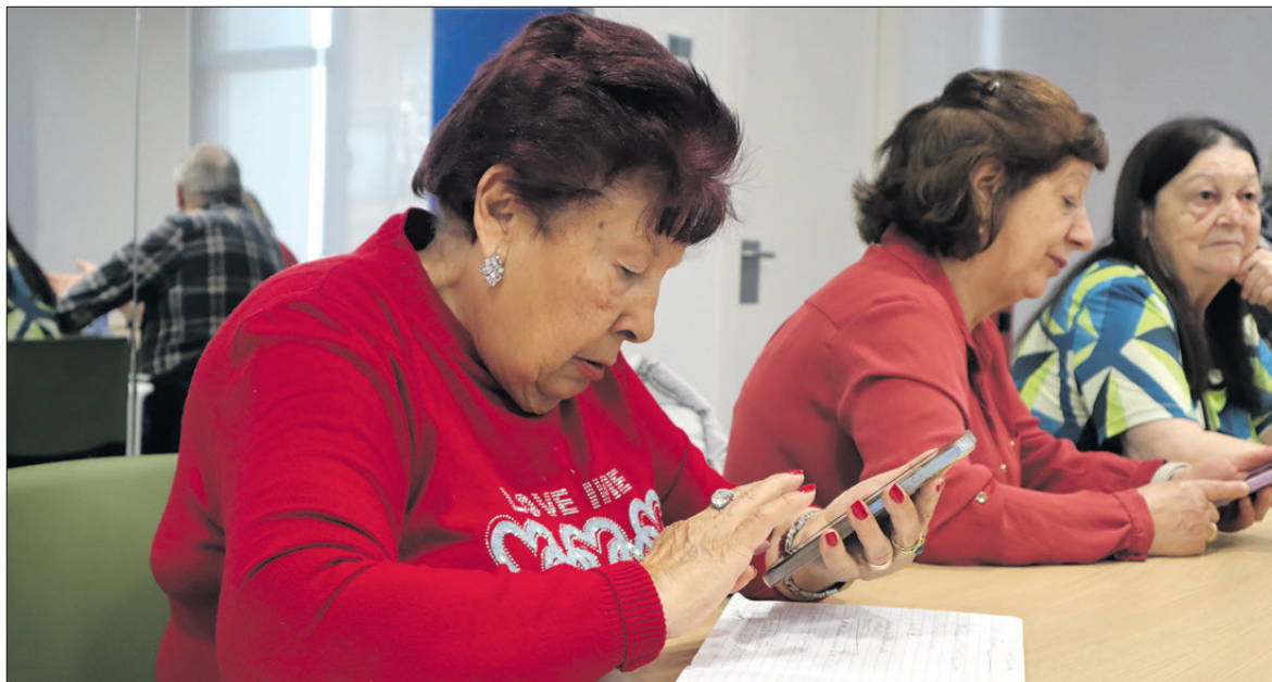
Formació. Les persones grans són el col·lectiu majoritari que participa en el Més Digitals.

Gràcies a la xarxa comunitària generada amb entitats i administracions, hem dut a terme formacions dinàmiques, personalitzades i gratuïtes que han permès als participants iniciar-se en l'ús del mòbil, navegar