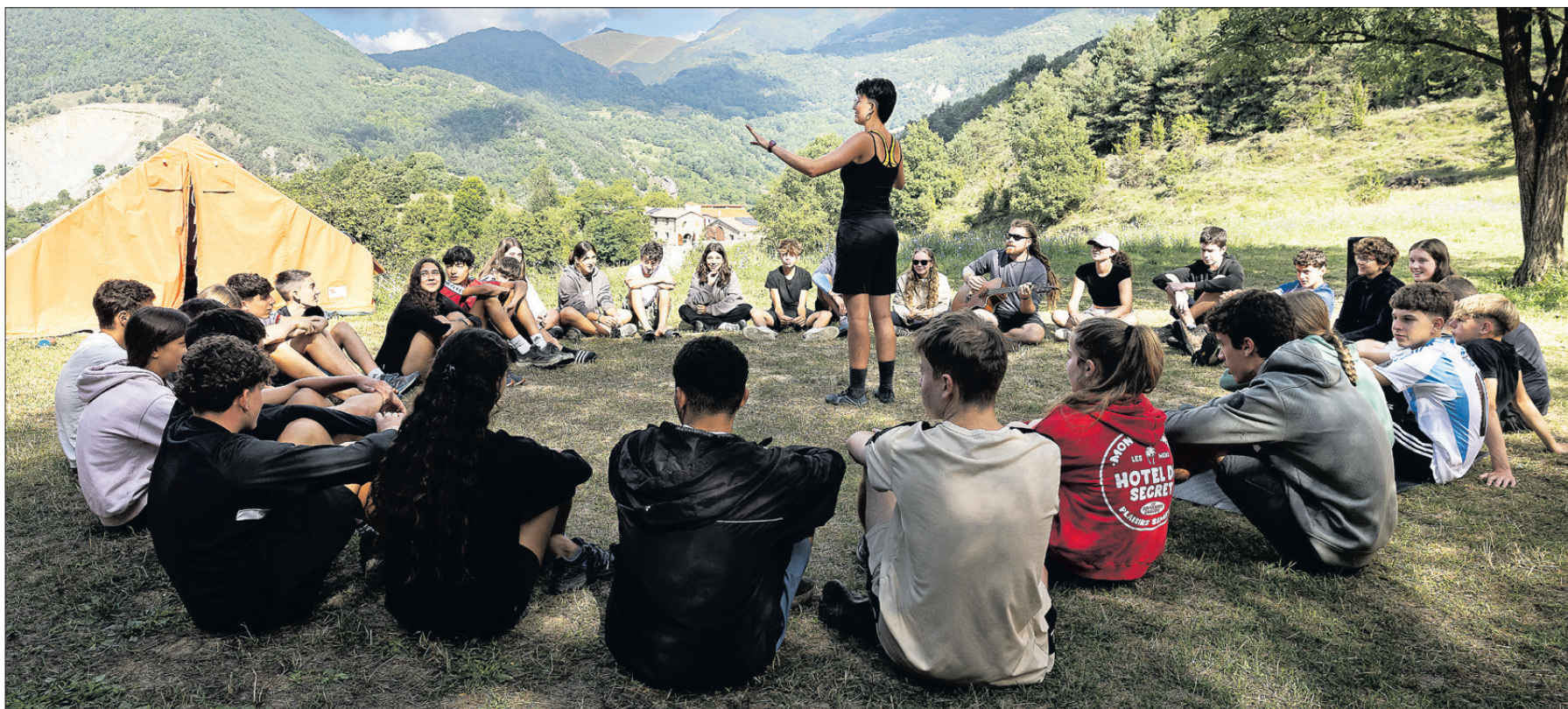
A l'aire lliure. És fonamental la planificació i previsió a l'hora d'organitzar activitats en el medi natural.

"Un estiu per viure" La nostra campanya d'estiu s'adapta a les noves condicions climàtiques