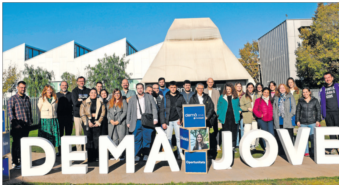
Diferents sectors. Representants de les empreses i entitats participants al Demà Jove a la jornada de presentació.

En la quarta edició, compta amb la implicació de gairebé una cinquantena d'empreses de diferents sectors. A més, a les empreses els permet conèixer i formar potencials professionals,