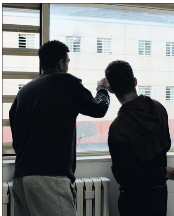
Projectes. Accions amb persones privades de llibertat.

També es genera un ambient confortable, de se-