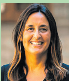
Esther Niubó Cidoncha CONSELLERA D'EDUCACIÓ I FORMACIÓ PROFESSIONAL

"Equitat i qualitat en l'educació i benestar de l'alumnat"