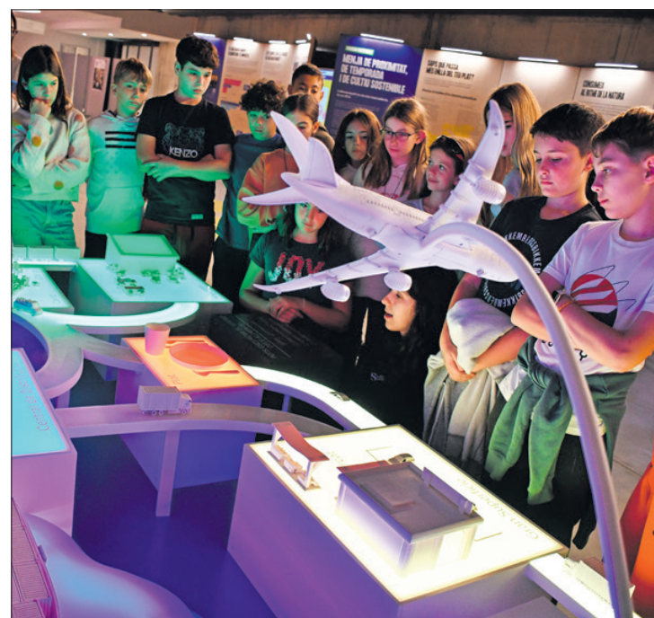
Reptes. El nou espai situat a la seu de Fundesplai (el Prat de Llobregat) aborda de manera didàctica la biodiversitat, el canvi climàtic i l'alimentació sostenible i saludable.

Renovada i ampliada Recull l'experiència de "Menja. Actua. Impacta" i inclou més activitats