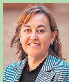
Sílvia Paneque i Sureda CONSELLERA DE TERRITORI, HABITATGE I TRANSICIÓ ECOLÒGICA

"Fomentarem el compromís i l'acció en xarxa amb accions clau en projectes educatius com la Xarxa d'Escoles Verdes"