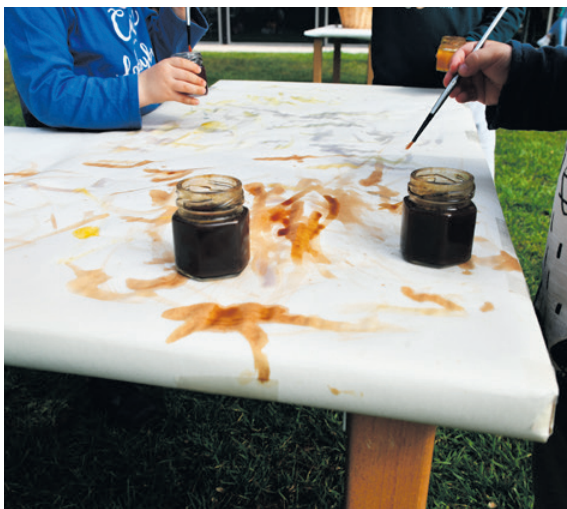
Connexió amb la natura. Afavoreix l'aprenentatge vivencial dels infants.

A partir d'una instal·lació amb diferents propostes i racons a l'aire lliure, el grup d'infants juga