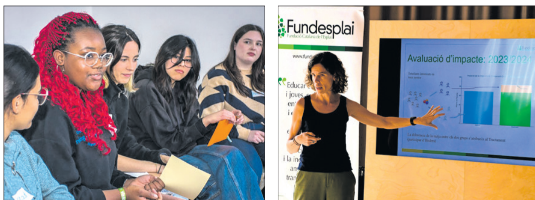
Interessos comuns. La coincidència d'entorn, gustos o gènere augmenta l'èxit de la mentoria.