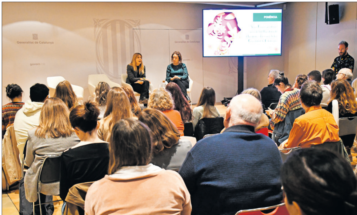
Entitats. Prop de 50 representants d'associacions van assistir a l'acte centrat en un sector més igualitari.

Per a la secretària, acabar amb la bretxa educativa que imposa rols diferenciats per a nenes i nens