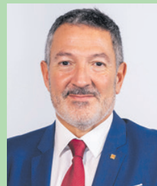
Miquel Sàmper i Rodríguez CONSELLER D'EMPRESA I TREBALL

"Ofereir als joves les eines necessàries per als reptes de futur i promoure la seva participació activa en la societat"