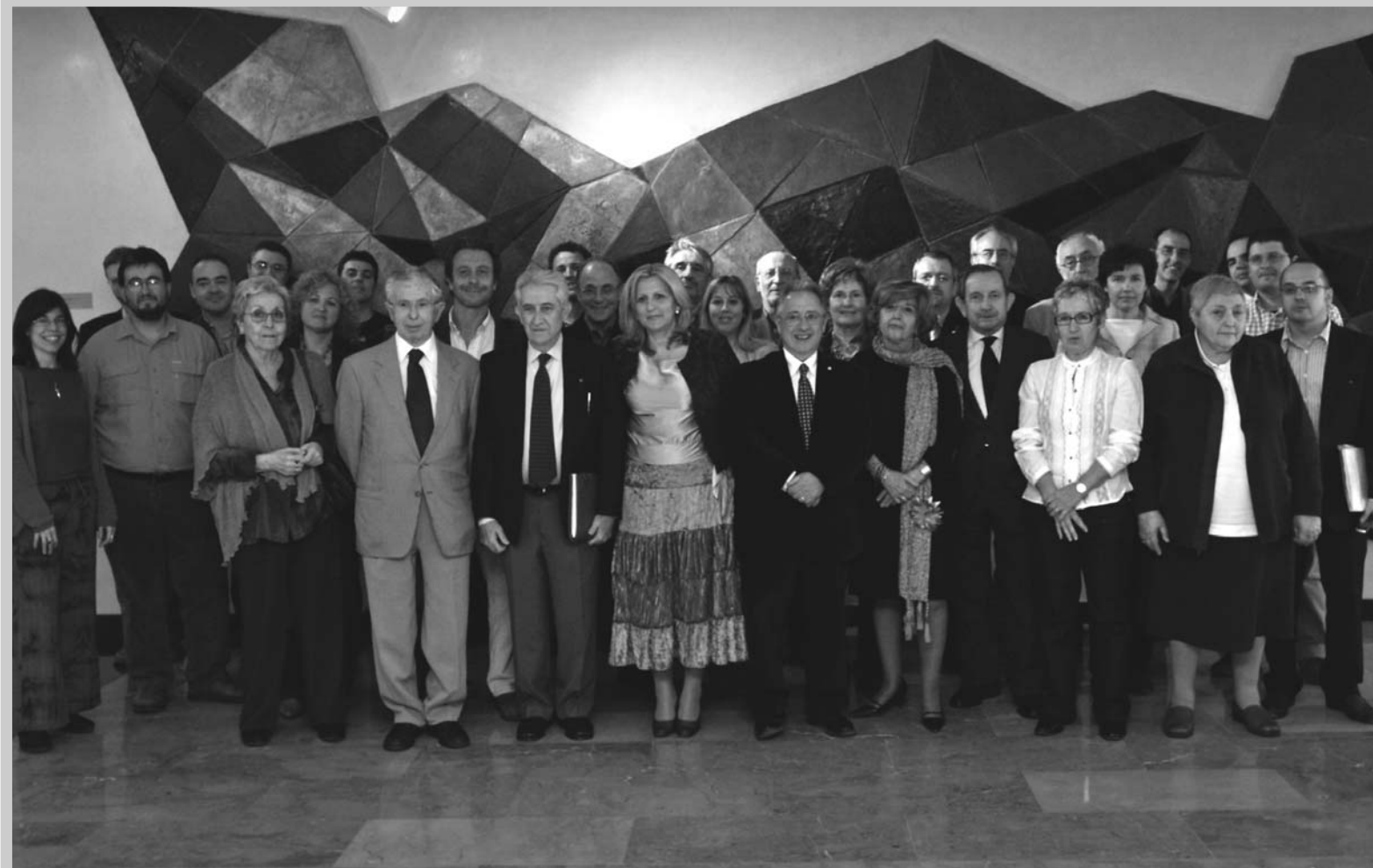
Encuentro del Consejo Asesor Fundación Esplai. Madrid, 28 de marzo de 2006