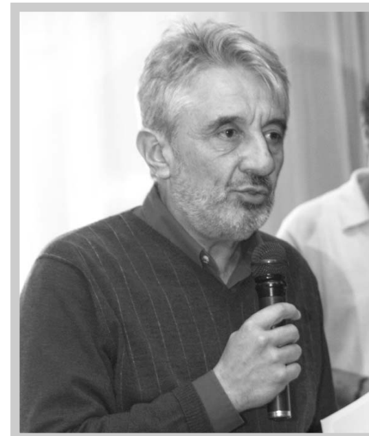
Luí M a López Aranguren Pedagogo

En unas cuantas líneas nos vamos a acercar al problema no resuelto del acceso a la ciudadanía de nuestros niños, adolescentes y jóvenes. En primer lugar abordaremos lo que llamo los "términos sagrados y confusos" o "a la papeleira con el miedo y la estupidez"; después nos referiremos a la formación de la propia identidad, a las identidades múltiples y a las comunidades de pertenencia en el apartado "¿Quién soy, con quién soy, soy mejor?"; luego hablaremos del estado de bienestar y ciudadanía, de la ciudadanía y la residencia estable y de la mejor y futura ciudadanía en el capítulo "Condiciones para que te juntemos"; por último, en el capítulo "¿...Y por qué no, qué nos lo impide?", hablaremos del futuro de nuestros hijos.