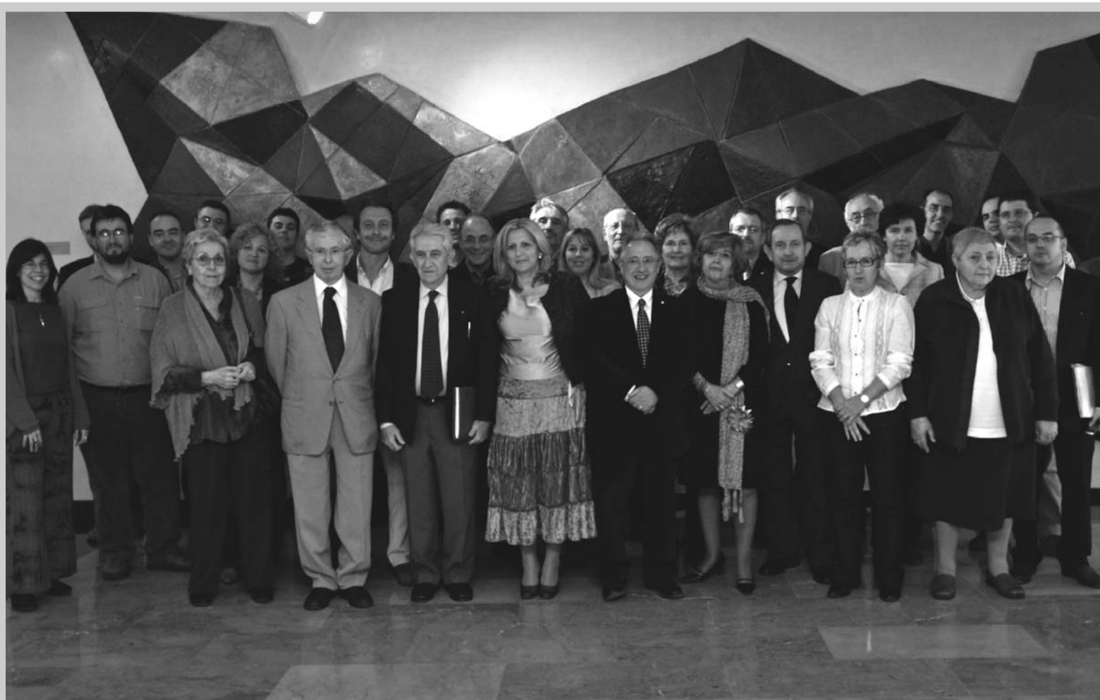
Trobada del Consell Assessor Fundación Esplai. Madrid, 28 de març de 2006