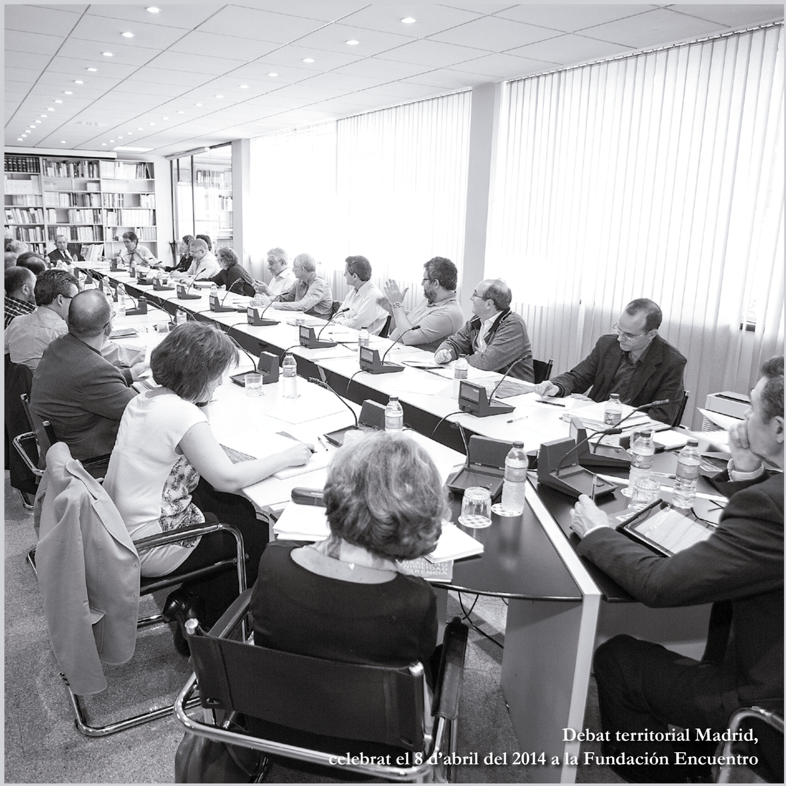
Debat territorial Madrid, celebrat el 8 d'abril del 2014 a la Fundación Encuentro