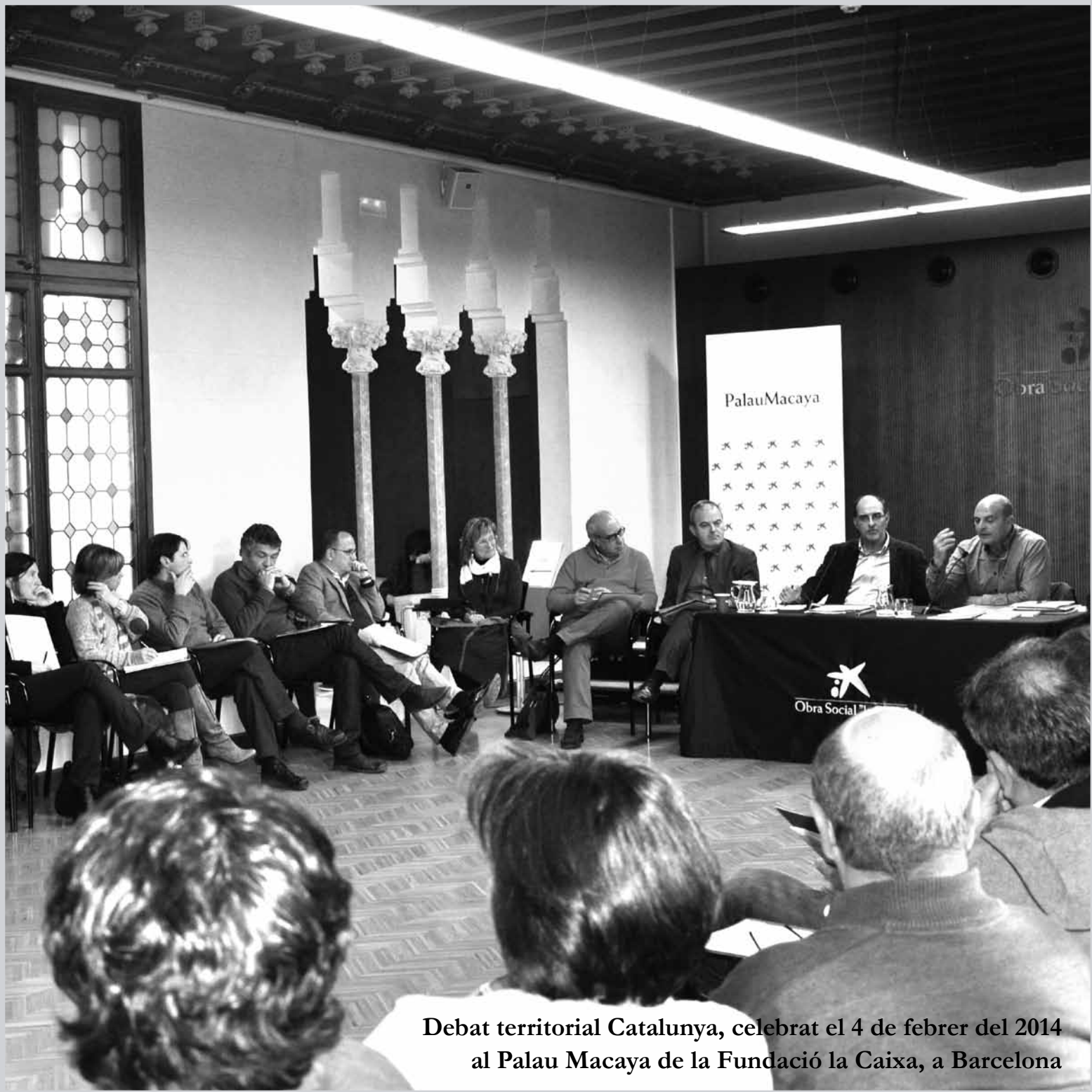
Debat territorial Catalunya, celebrat el 4 de febrer del 2014 al Palau Macaya de la Fundació la Caixa, a Barcelona