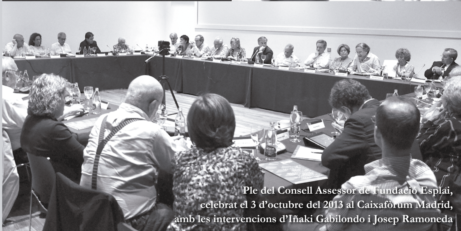
Ple del Consell Assessor de Fundació Esplai, celebrat el 3 d'octubre del 2013 al Caixaforum Madrid, amb les intervencions d'Iñaki Gabilondo i Josep Ramoneda