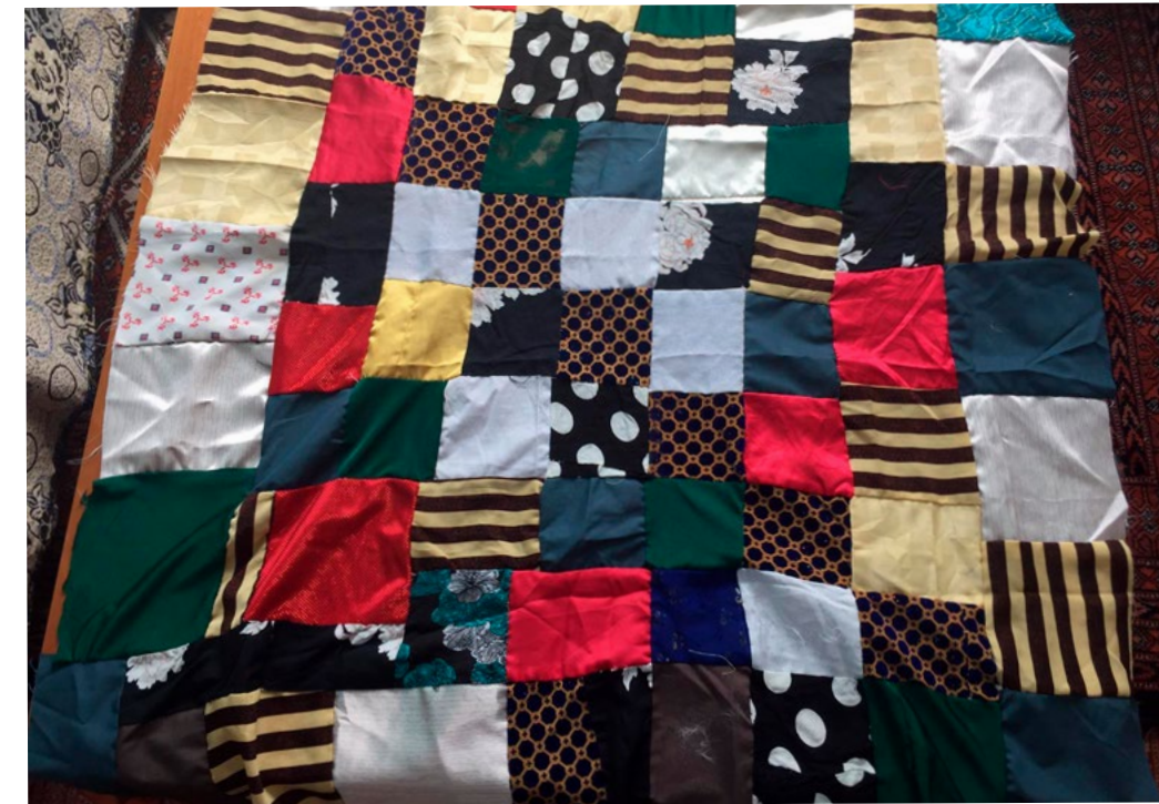
La maleta amb trossos de roba que va fer la meva mare

Sortia del meu país amb una idea, pensant que estaria una setmana fora o com a molt sis mesos i després tornaria a l'Afganistan. Mai vaig imaginar que sis mesos es convertirien en 14 anys sense els braços de la mare, l'olor del meu país. Sense totes les persones que estimava.