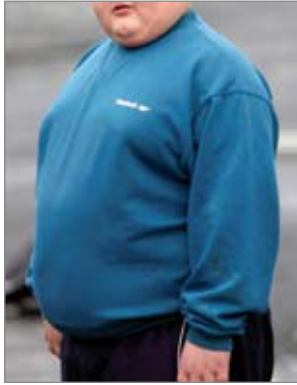
Imatge 1 Infant amb sobrepès