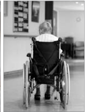
Imatge 5 Un avi en cadira de rodes