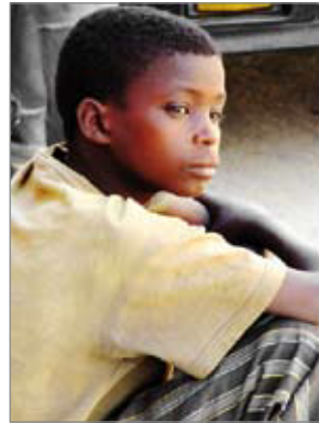
Imatge 4 Infants amb trets d'una altra cultura