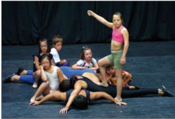
Imatge 3 Infant amb síndrome de Down