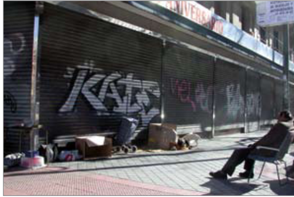
Imatge 2 Persona en situació de sense llar